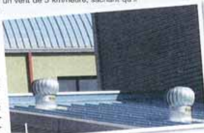
Quelques extracteurs d'air sur le toit pour faire chuter la température.

Les grandes chaleurs sont de retour et dans les maisons aussi, la température monte d'un cran. Plusieurs solutions permettent toutefois de se maintenir au frais, telles que la climatisation ou une bonne isolation (lire encadré). A moindre coût, on peut aussi équiper son toit d'un extracteur d'air qui évacue l'air chaud retenu sous les combles où, en plein été, la température peut atteindre 75°. « Ce qui provoque un véritable effet de four qui communique la chaleur à l'intérieur des bâtiments », indique Yann Zonca, chargé d'exploitation chez Solar Screen. La société commercialise depuis 12 ans des « ventilateurs de toit » à pales qui tournent sous l'effet de la convection naturelle (la chaleur qui monte). « Un ventilateur extrait environ 500 m 3 d'air à l'heure avec un vent de 5 km/heure, sachant qu'il y a toujours du vent à La Réunion », poursuit Yann Zonca. Et promis, les appareils sont résistants aux cyclones, étanches, inoxydables et durables (plus de 50 ans). Plusieurs extracteurs peuvent être nécessaires pour assurer une bonne température. En moyenne, l'achat et l'installation d'un exemplaire (déplacement compris) coûte aux environs de 500 euros.