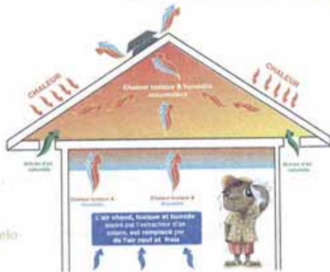
A plein régime, l'extracteur solaire évacue 2124 m 3 par heure.

L'air chaud, issu de l'habitat et des locaux, est évacué par le ventilateur solaire.